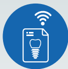
ZI LIVE CASE PRESENTATIONS