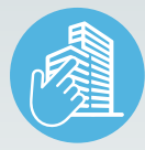
ZIMVIE INSTITUTE PROGRAMS