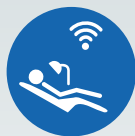
ZI LIVE CLINICAL

Contactez-nous pour plus d'informations concernant les possibilités de formation suivantes :