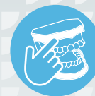
ZI IMPLANT SKILLZ* SERIES