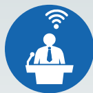
ZI LIVE WEBCASTS